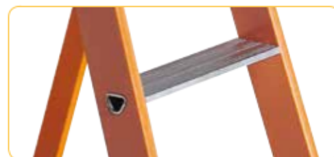
• Gradini in alluminio ribordato