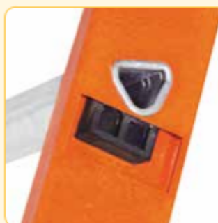
• Sezione attacco gradino montante con rinforzo anti-dissesto